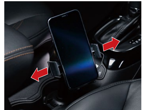
触れると、自動でアームがオープン