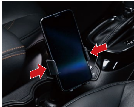
スマホを置くと、自動でアームが閉じる