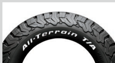
サイドウォール ホワイトレター入り

本格的オフロードをイメージするトレッドパターンで、オフロード性能はもちろんオンロード走行にも優れる BFGッドリッチ製オールテレーンタイヤと力強いデザインのMOPAR ® 製純正17インチアルミホイールのセット。